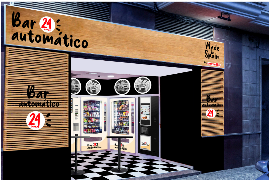
Exterior de "Bar Automático".