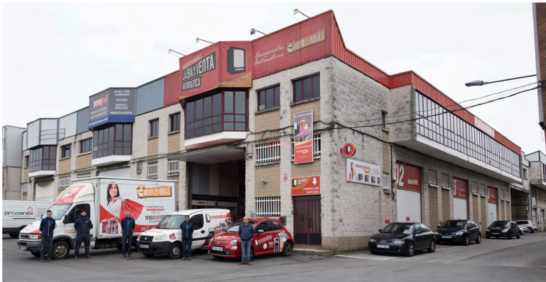
Nuestro equipo técnico.

También para tener lo último y más avanzado en máquinas expendedoras de última generación acudimos a todas las ferias del sector a nivel mundial: Las Vegas, Shangay, Tokio, Milán y Londres.