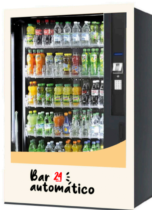
EXPENDEDORA DE CRISTAL ROBÓTICA DE BEBIDAS FRÍAS