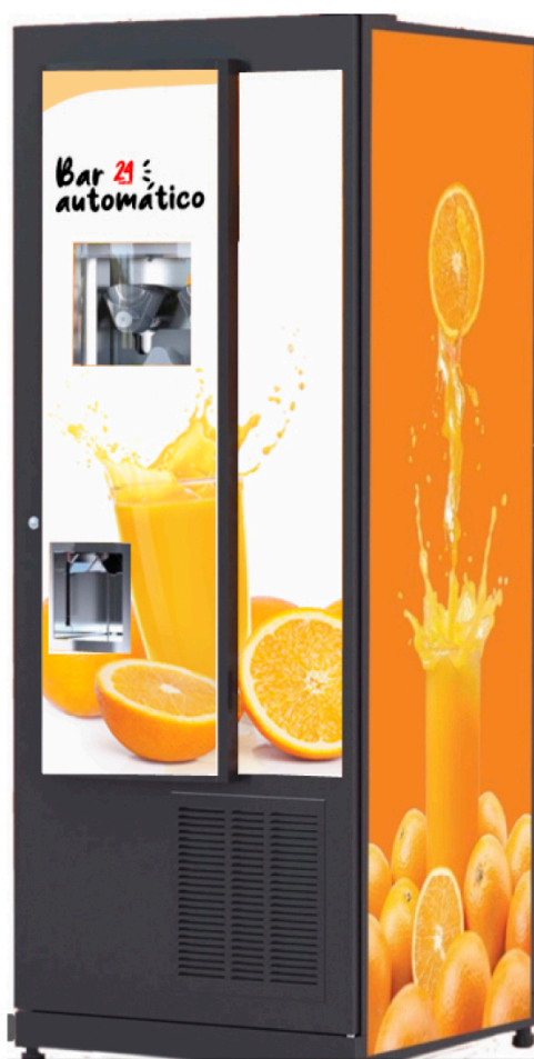
EXPENDEDORA DE ZUMO RECIÉN EXPRIMIDO

Para las personas, que no quieren consumir calorías, nuestra expendedora de zumo de naranja recién exprimido. Nuestra “máquina” de la salud preparada para que el cliente que pueda ver a través de su ventanilla transparente como se prepara su zumo recién exprimido y refrigerado en tan solo 40 segundos.