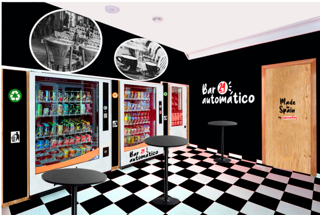
Interior de nuestro “bar automático” con música ambiente, mesas y papeleras encastradas de reciclaje.

Música ambiente con altavoces regulables en el techo para crear un ambiente tranquilo y relajado donde tomar una consumición y distraernos un rato.