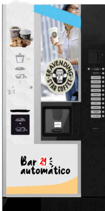
EXPENDEDORA DE CAFÉ Y BEBIDAS CALIENTES

Expendedora de bebidas frías de cristal robótica , una vitrina con 45 selecciones diferente, que cobra y vende sola las 24 horas del día los 365 días del año. Una de nuestras máquinas más rentables sin duda alguna.