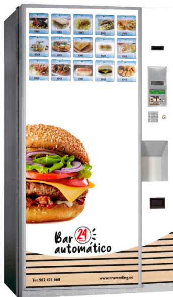
EXPENDEDORA COMIDA CALIENTE

Máquinas en las que podrás encontrar variados sandwiches envasados para su perfecta conservación, snacks de todo tipo dulces y salados, bollería o bebidas de diferente tipo.