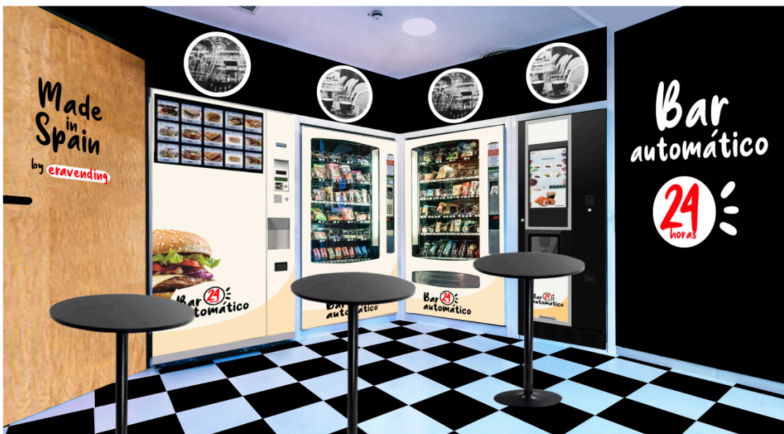
Interior de "Bar Automático".