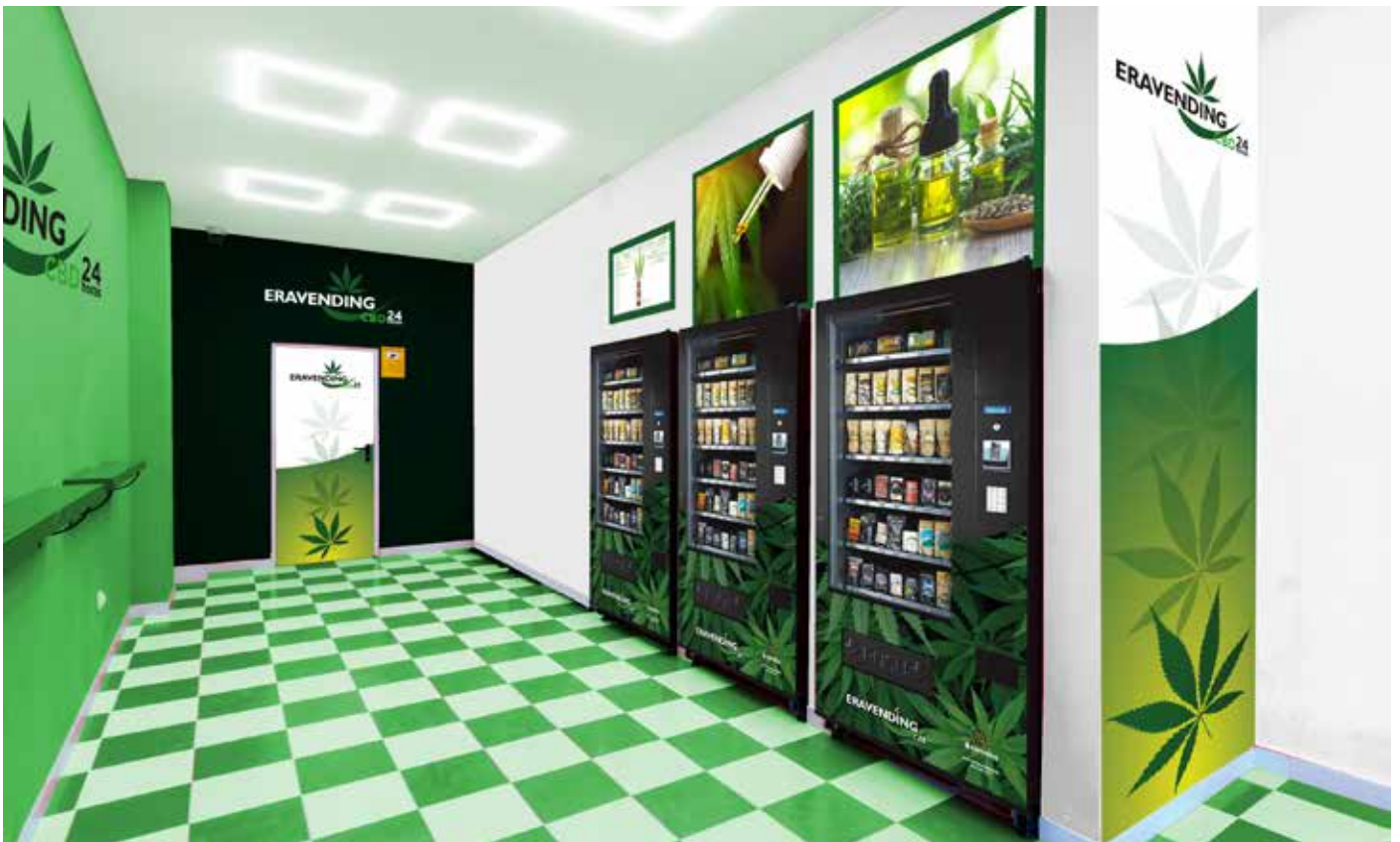
Simulación de instalación