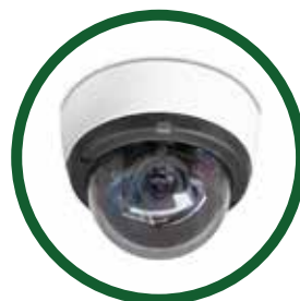
Cámara vigilancia a tiempo real