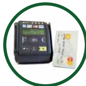
Pago con tarjeta y smartwatch