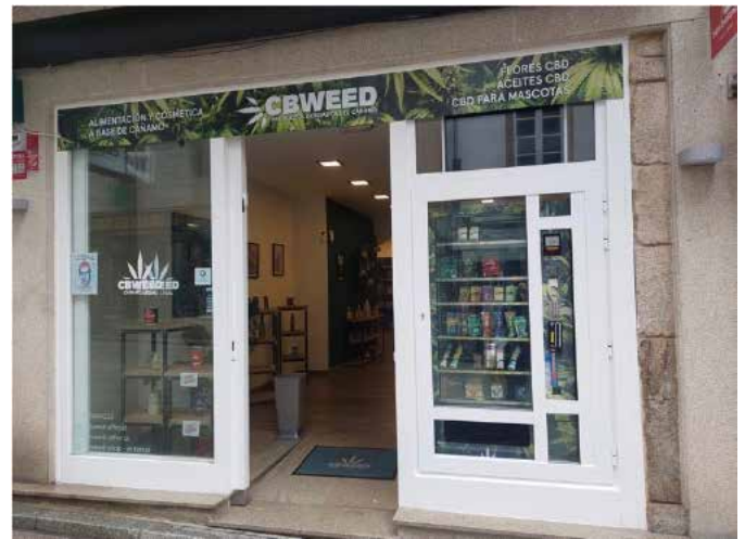
Después (con máquina)