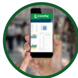
Control de ventas y stock mediante aplicación