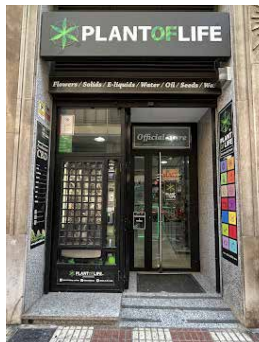
Después (con máquina)