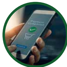
Pago mediante movil