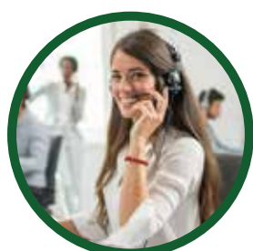
Teléfono de atención al cliente

Atendido por los propietarios de la tienda.