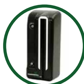
Módulo de identificación de mayoría de edad