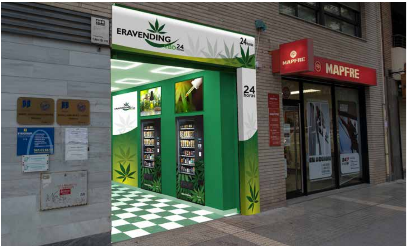
Simulación de instalación